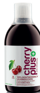
CHERRY PLUS ® DAS ORIGINAL CLASSIC Montmorency-Sauerkirschen-Konzentrat Einzelflasche: PZN 12529355