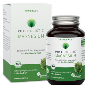
PHYTHOLISTIC ® MAGNESIUM aus Bio-Meerlattich Trägt zum Erhalt von Knochen und Zähnen bei PZN 14178730