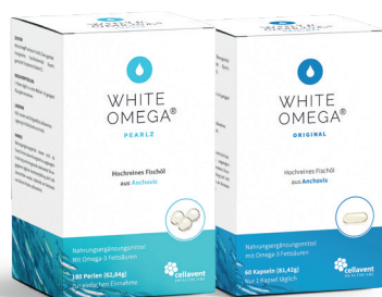
WHITE OMEGA ® PEARLZ / ORIGINAL Für das Herz, Hirn und die Augen 180 Perlen: PZN 14178753 PEARLZ 60 Kapseln: PZN 14178747 ORIGINAL